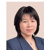
高 黎静 教授