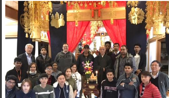
東覚寺(トウカクジ)で座禅体験