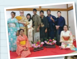
神栖市国际交流大会