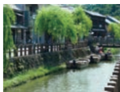
小江戸・佐原街景