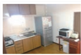
基本设备 (冰箱, 洗衣机, 桌子, 椅子, 窗, 无线网络)