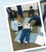
和危机管理学部保健医疗学科的学生一起救急救命演习