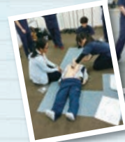
危機管理学部保健医療学科の学生と救急救命