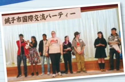
国際交流パーティー