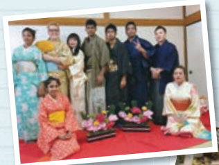
神栖市国際交流フェスティバル