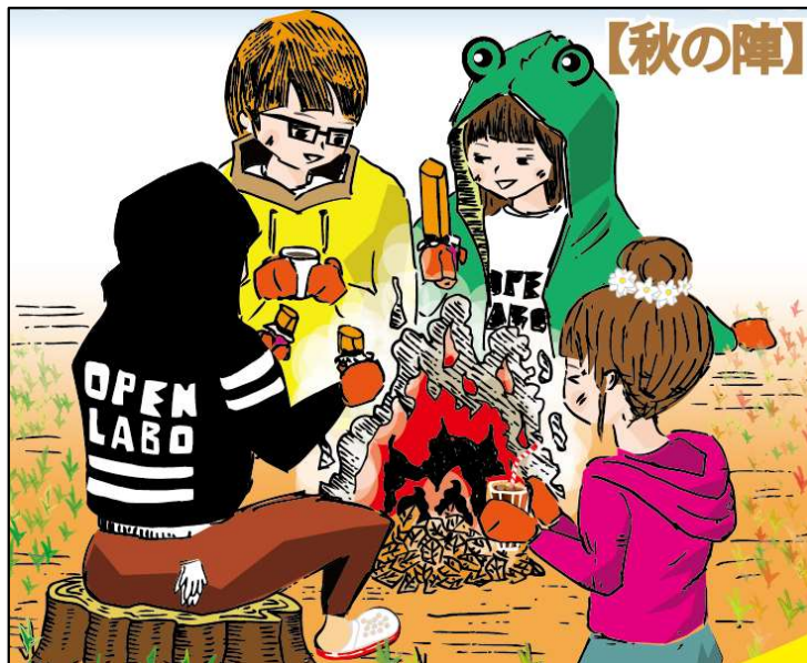
「画：みんなで焼き芋おいしいな」間違い探し全部で12か所!